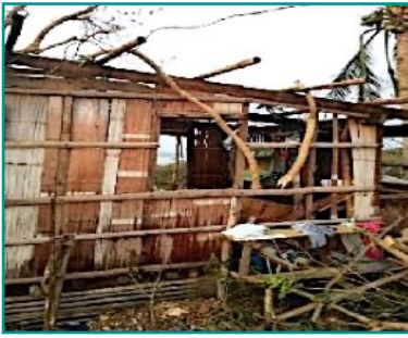
Dégâts causés par RAI