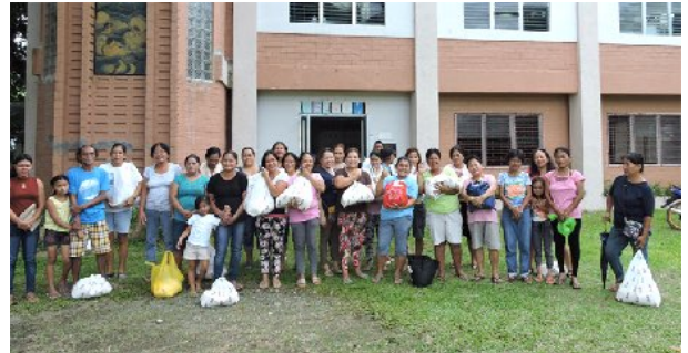
Distribution de sacs de riz