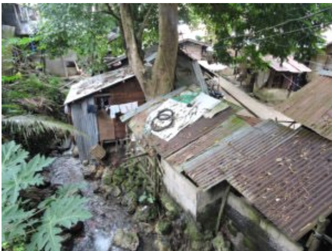
Habitations de quartiers défavorisés une aide pour des besoins vitaux : nourriture, soins, vêtements...

Permettre à des enfants d'accéder à l'éducation, la scolarité Soutenir des institutions locales déjà investies dans la lutte contre la pauvreté