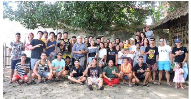
Groupe de jeunes - Mantahan