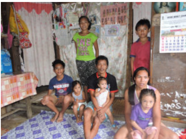
Visites de familles d'élèves du Foyer St Joseph